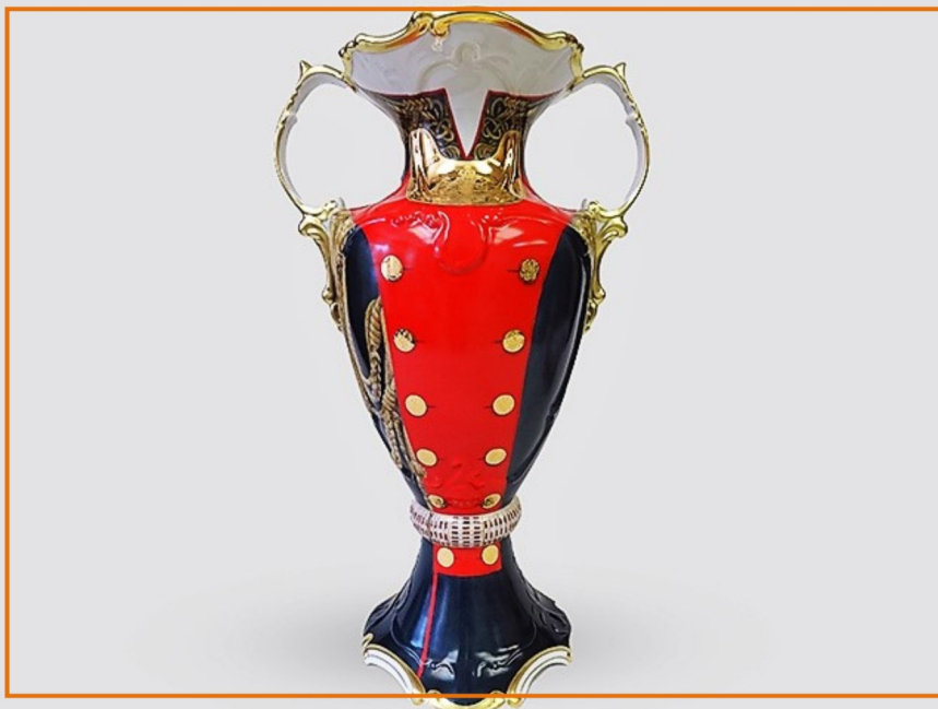
vaas Napoleon Bonaparte (Les Invalides Parijs)

Dankzij deze innovaties stijgt de porseleinfabriek naar de meest elite groep van Europese fabrikanten. Er worden grote investeringen gedaan en in de loop van 2008 wordt de hele fabriek stap voor stap opnieuw gemoderniseerd waardoor ze de meest technisch uitgeruste fabriek van Tsjechië wordt. Het bedrijf begint samen te werken met toonaangevende internationale bedrijven en vervaardigd exclusieve met de hand beschilderde porseleinen marketings-artikelen en persoonlijke geschenken. Items gemaakt door het Rudolf Kämpf filiaal krijgen een sterke positie op de markt in het Midden-Oosten via de exclusieve distributeurs Dunes of Arabia, in Rusland via de exclusieve distributeur Art Market Group en in Oekraïne via het Rudolf Kämpf Ukraine filiaal. Daarnaast opent het bedrijf enkele mono-merkwinkels. In 2008 schenkt men een met de hand gemaakte vaas, versierd met de afbeelding van Napoleon Bonaparte, aan het Nationaal Legermuseum, Les Invalides, in Parijs.