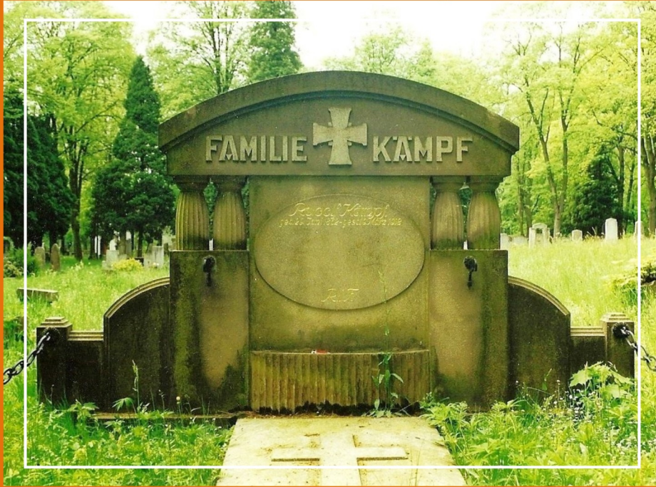
graf van Rudolf Kämpf