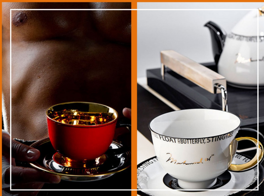
Collecties ter ere van Muhammad Ali

Op 12 april 2012 ontvangt de porseleinfabriek in Moskou een prestigieuze prijs van de internationale competitie 'EFFIE Brand of the Year 2011'. De prijs wordt gewonnen in de categorie 'luxe goederen en diensten'. Voor de 70 e verjaardag van Muhammad Ali produceert men een jubileumcollectie in een gelimiteerde oplage van 70 sets. Ali zei over zichzelf: 'I am the Greatest'. Deze zin siert de schoteltjes van de set. De bijbehorende kopjes zijn aan de binnenkant bekleed met 24-karaats goud met daarin aangebracht de handtekening van deze legende. Een andere gelimiteerde oplage van 430 sets, opgedragen aan Muhammad Ali, bestaat uit een collectie in zwart-wit waarbij de gevleugelde uitspraak van deze legende 'Vlieg als een vlinder en steek als een bij' rondom de kopjes en schoteltjes is aangebracht. De gouden handtekening van Muhammad Ali schittert daarbij in het midden.