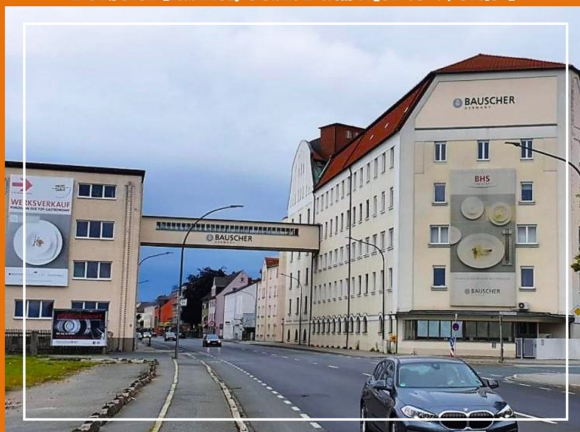
Porseleinfabriek Gebr. Bauscher te Weiden

Oprichting van Porzellanfabrik Gebr. Bauscher in Weiden waar men vooral porselein produceert dat is afgestemd op de speciale behoeften van de gastronomie, ziekenhuizen en soortgelijke voorzieningen.