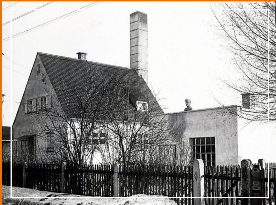
Allach Porseleinfabriek te München 1935

Op basis van een nieuw concept worden de producten onder het merk 'Eschenbach' geproduceerd van kwaliteitsporselein dat resulteert in een sterke economische opleving. Door plunderingen tijdens de Tweede Wereldoorlog door Amerikaanse soldaten zijn alle porseleinen designseries, alle brochures, bijna alle bedrijfsdocumenten en correspondentie verloren gegaan. Slecht enkele kostbare stukken uit de periode 1913-1945 overleven deze periode. Om de productie weer op gang te krijgen, gebruikt de fabriek mallen van de failliet gegane porseleinfabriek Allach-München GmbH. Dit resulteert in een assortiment van vooral sierborden en tafelgerei. Vanaf 1947 tot 1953 is professor Theodor Kärner hoofd van de kunstafdeling in de fabriek (beeldhouwer, keramisch ontwerper, hoogleraar en tot 1945 artistiek directeur bij Allach-München GmbH).