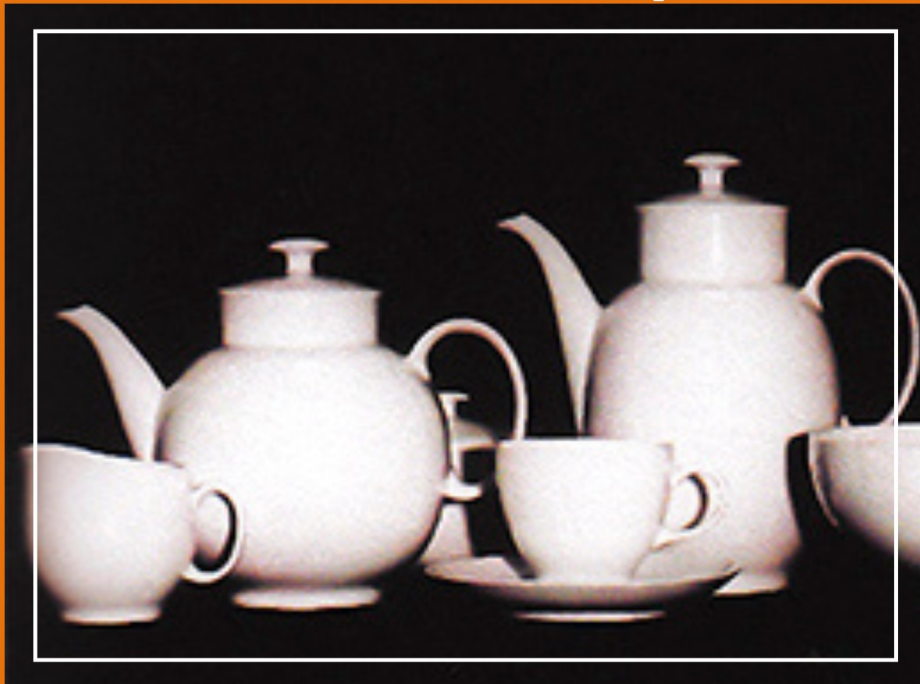
Edessa van Andries Dirk Copier

In 1967 ontvangt het servies 'Edessa' van Andries voor Eschenbach niet alleen de 'perspluim' maar ook het certificaat 'Gulden Vorm' net als zijn witte porseleinen servies 'Hera'. De fabriek produceert hoogwaardig huis- en hotelporselein onder het merk 'Eschenbach Porzellan' en in 1977 zijn er circa 700 medewerkers in dienst. In 1995 wordt de fabriek als één van de eerste Duitse porseleinfabrikanten gecertificeerd volgens DIN (Deutschen Institut für Normung) en de internationale norm ISO.