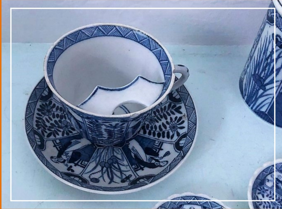
Mosa Maastricht Snorrekopje